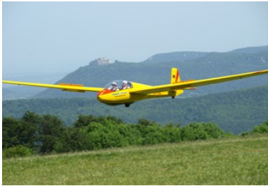
ASK-13 im Anflug Unser Schulflugzeug