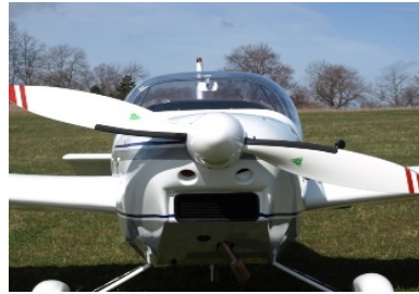
Reise-Motorsegler SF 25 C 100 hp 150 km/h