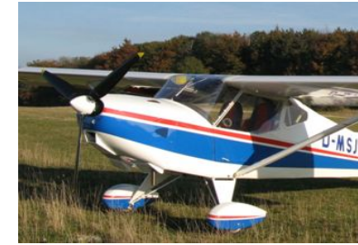
Ultraleicht-Flugzeug FK 9 M 2 80 hp 120 km/h